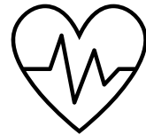
Health & Medical Technology