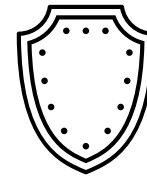
Security & Defence