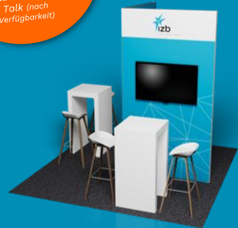
Beispielhafte Darstellung, Details können abweichen

Sie haben Interesse? Jetzt anmelden unter: izb@wolfsburg-ag.com